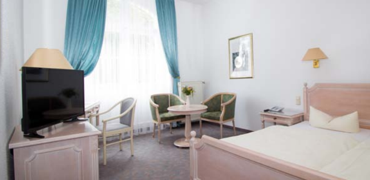
Beispielzimmer in unserem Altbau